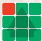
Одна из 9 карт расположения